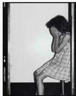
Les Pieds sur terre Bureau de production