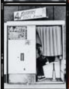
Yann Voté régisseur lumières

Portant un fort intérêt aux divers processus de création, il construit les décors, récupère à tout va, imagine des systèmes lumineux, et met tout ce petit monde en réseau. De l'invisible à l'imposant, de la lueur au palpable, j'aime à suggérer l'objet scénique dans sa globalité, comme partie intégrante de la distribution, au service du texte ou des buts de l'équipe de création.